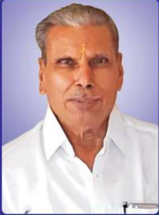
ચક્ષુદાન કરેલ છે.